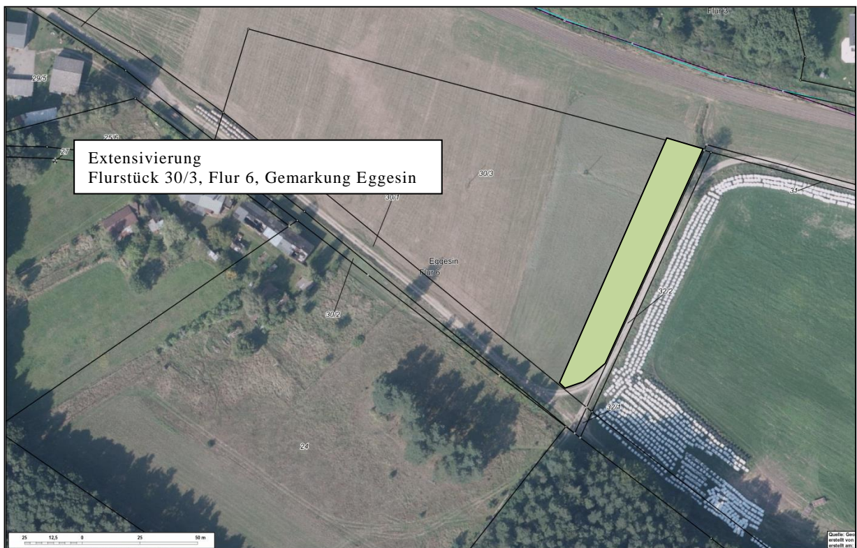
Abbildung 2: Lage der Kompensationsmaßnahme

Anthropogene Einflussfaktoren können sich auf Grund der zu erwartenden geringen Intensität der vorhersehbaren Störfaktoren nicht auf die Wirksamkeit der Maßnahme auswirken. Resultierend ist ein Leistungsfaktor von 1 anzurechnen.