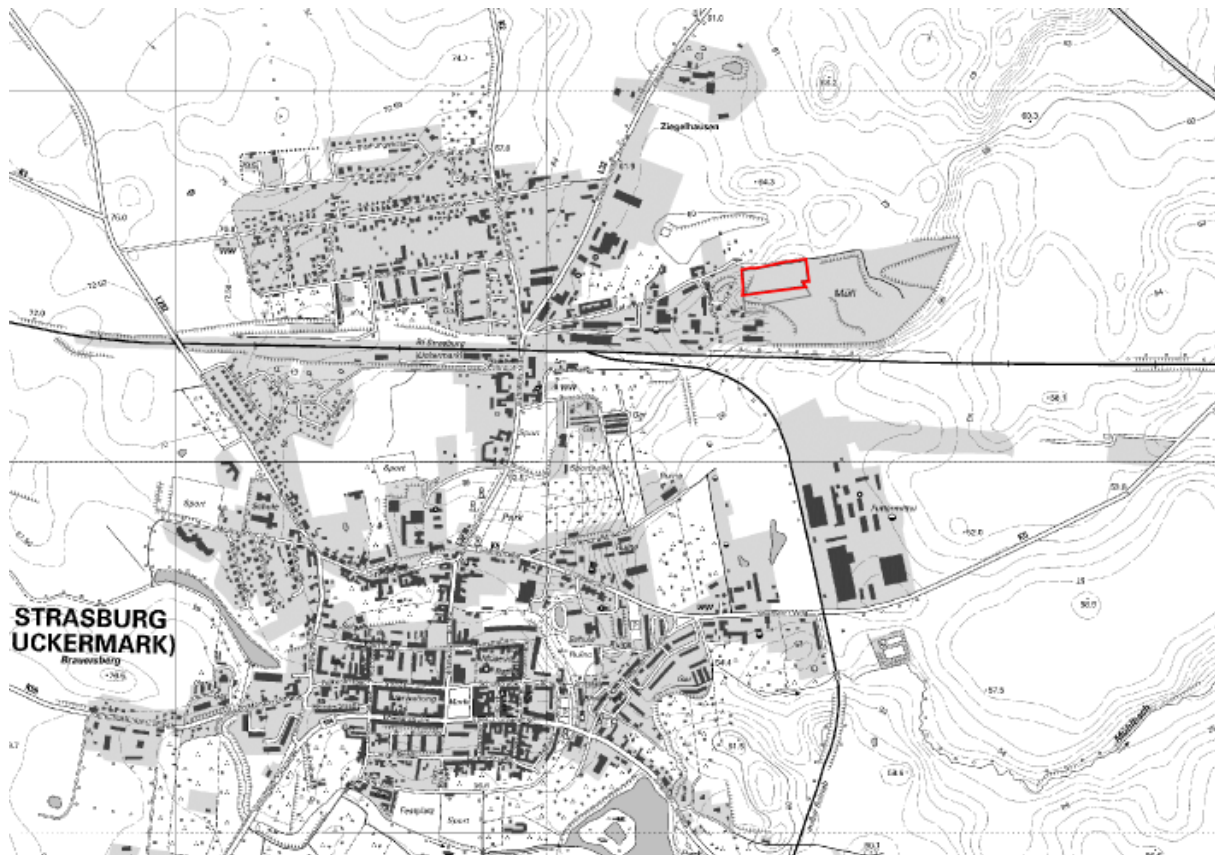
Abb. 1: Geltungsbereich (Kartengrundlage digitale Topographische Karte © GeoBasis-DE/M-V < 2012 >)