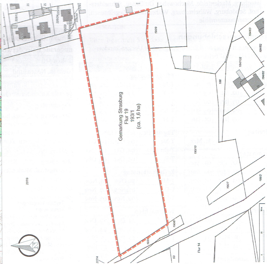
Anlage 1: Vorhabenbezogener Bebauungsplan Nr. 6 „Solarpark Schönhauser Straße“ der Stadt Strassburg (Um.), Ausgrenzung