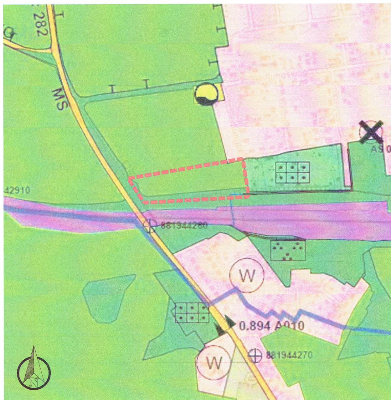
1. Änderung des Flächennutzungsplanes der Stadt Strasburg (Um.) für den Bereich "Solarpark Schönhauser Straße" Ausgrenzung